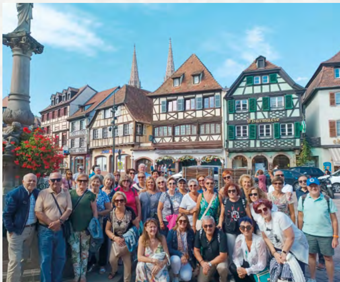
Viaje a Alsacia (Francia)

Nuestros mejores deseos para todos y felices fiestas.