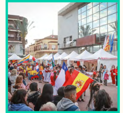
IV Jornada Intercultural