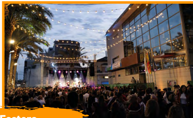
Medio Año Festero