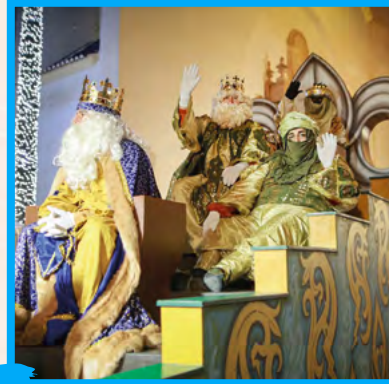
Cabalgata de Reyes